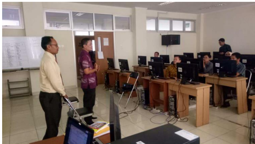
Gambar 2 : Sambutan dari Pimpinan Fakultas Ilmu Sosial dan Ilmu Politik UIN Sunan Gunung Djati Bandung

Pemograman (MTK-1) UIN Sunan Gunung Djati Bandung sesuai dengan surat undangan sebagai narasumber Nomor B-555/Un.05/III.8/KS.0.2/10/2019.