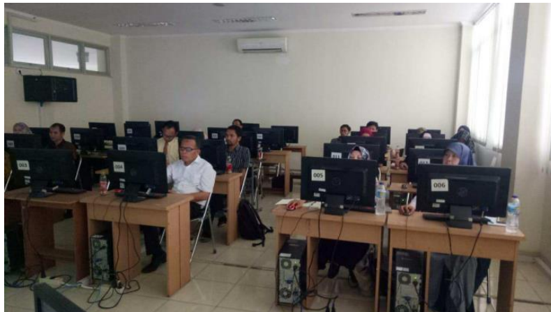
Gambar 4 : Praktikum Bersama Pengolahan data menggunakan SmartPLS 3.0

penelitian. Sementara itu, kesulitan peserta dalam memahami evaluasi model pengukuran dibantu dengan pemaparan contoh perhitungan dan analisis evaluasi model pengukuran pada penelitian yang dijadikan sebagai contoh. Pemaparan dan penjelasan contoh penelitian tersebut mampu meningkatkan pemahaman peserta yang mengalami kesulitan pada tahap ketiga. Peningkatan pemahaman ini menunjukkan peningkatan yang serupa pada kegiatan yang dilaksanakan oleh Yuliawan [8]. Tahap terakhir pada kegiatan ini adalah praktikum pengolahan dan analisis PLS-SEM menggunakan software SmartPLS 3.0. Praktikum ini dilakukan Bersama dengan demonstrasi praktikum secara bersamaan dengan peserta.