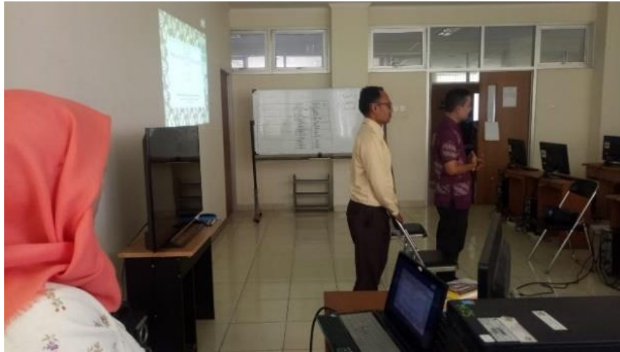
Gambar 1 : Perkenalan sebagai Narasumber

Kegiatan dilaksanakan selama satu hari pada 16 Oktober 2019 pukul 11.00 s.d. 13.00 WIB bertempat di Laboratorium Terpadu Gd. Solahuddin Sanusi Lt. 4, Lab. Dasar-dasar