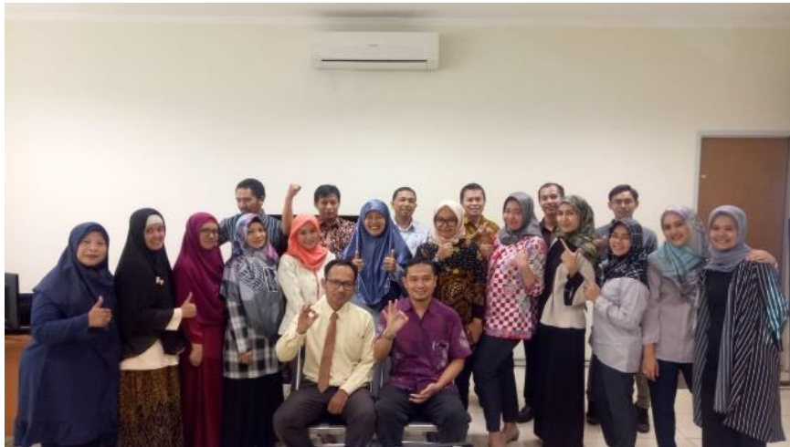
Gambar 5 : Narasumber, Peserta Pelatihan dan Pimpinan Fakultas Ilmu Sosial dan Ilmu Politik UIN Sunan Gunung Djati Bandung

analisis dalam format excel maupun dalam bentuk R-Software . Kendala yang sama ditemui kegiatan serupa yang dilaksanakan oleh Budiarsi pada dosen dan mahasiswa Fakultas Ekonomi Jurusan Manajemen dan Akuntansi Universitas Merdeka [9].