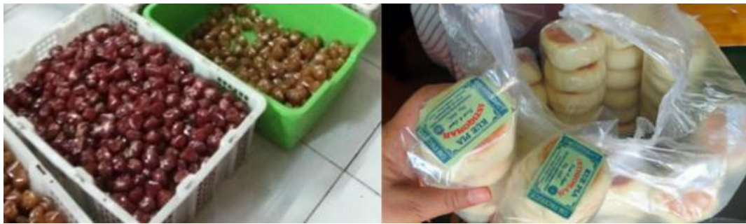
Gambar 1: Produk UMKM

cara komunikasi, maupun jarak yang jauh. Sebuah media berbasis internet yang banyak dimanfaatkan untuk pertukaran informasi, komunikasi, hiburan, transaksi bisnis dan promosi. Datanya diletakkan dalam sebuah server atau hosting dan bisa diakses kapanpun,