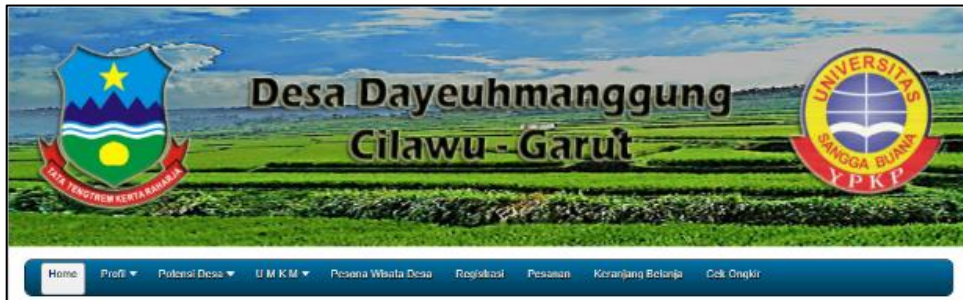
Gambar 3 : Halaman Muka Website