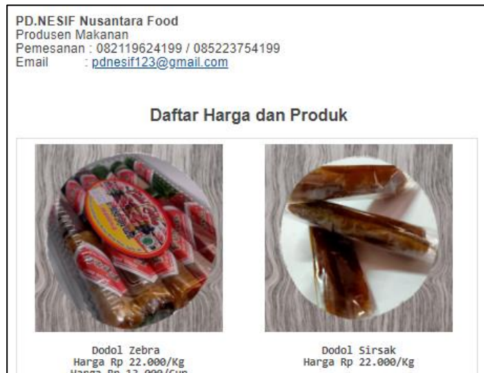
Gambar 4: Profil UMKM dan Produknya