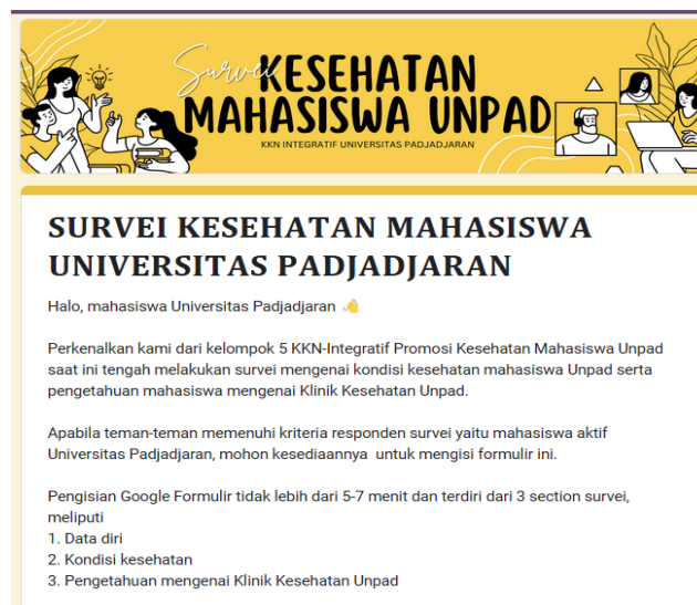
Gambar 1: Survei dengan Media Google Formulir

of task (MET) menit per minggu untuk orang dewasa (3). Aktivitas fisik seseorang bergantung pada seberapa banyak kegiatan yang orang tersebut lakukan. Seperti halnya pada mahasiswa yang sedang mengalami tahap perkembangan dengan pemenuhan berbagai tugas sehingga memiliki aktivitas yang sangat padat.