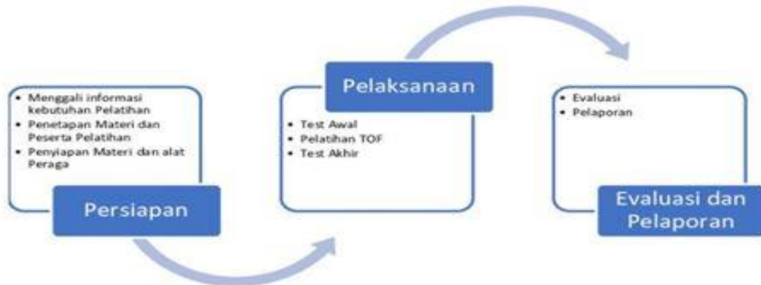
Gambar 1: Tahap Pelaksanaan Kegiatan

pendekatan ceramah, diskusi dengan strategi FGD ( Focus Group Discussion ) dengan melibatkan partisipasi peserta kegiatan yaitu Guru, tenaga kependidikan serta siswa.