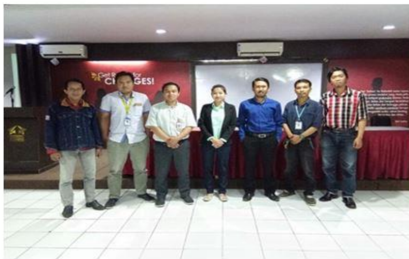
Gambar 4: Tim Kegiatan Pengabdian Masyarakat

Sebagaimana diketahui, PTK tidak hanya sekedar dimanfaatkan guru sebagai persyaratan kenaikan pangkat atau golongan. Melainkan juga sebagai suatu upaya peningkatan kualitas atau mutu proses belajar-mengajar yang itu diharapkan semakin meningkat dari sebelumnya (4).