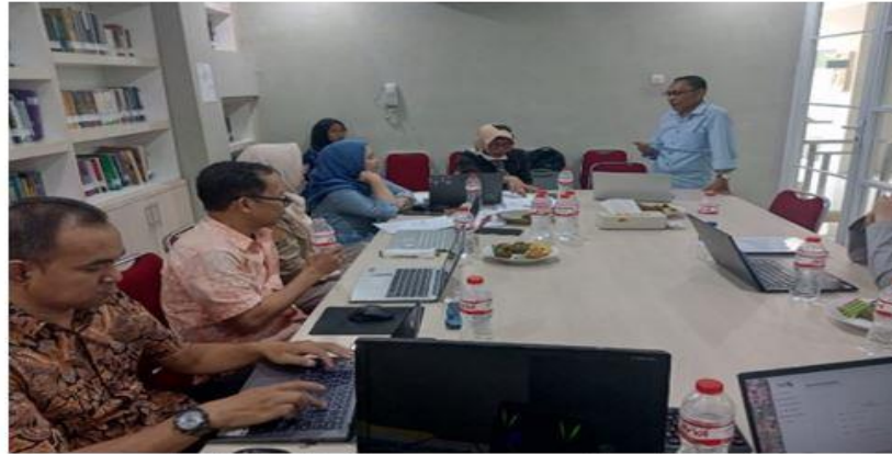
Gambar. 3: Proses pendampingan Modul Pembelajaran