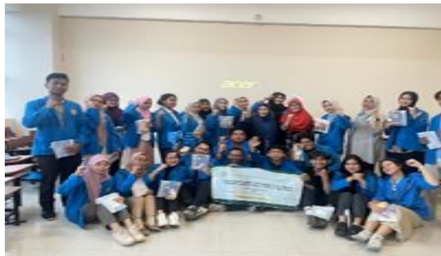
Gambar 1: Kegiatan PKM

Kegiatan pengabdian kepada masyarakat ini berlangsung dengan lancar dan mendapat respons positif dari para peserta. Mahasiswa Universitas Pamulang sangat antusias dalam mengikuti berbagai sesi yang diselenggarakan. Gambar 1 merupakan hasil pelaksanaan program berdasarkan tahapan kegiatan: