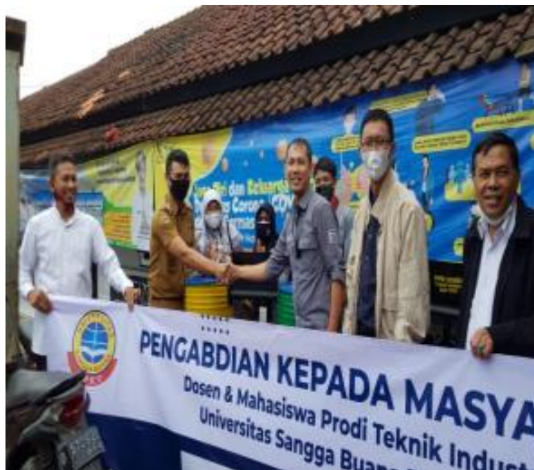
Gambar 2: Proses Evaluasi dan Penyerahan Drum Tempat Sampah