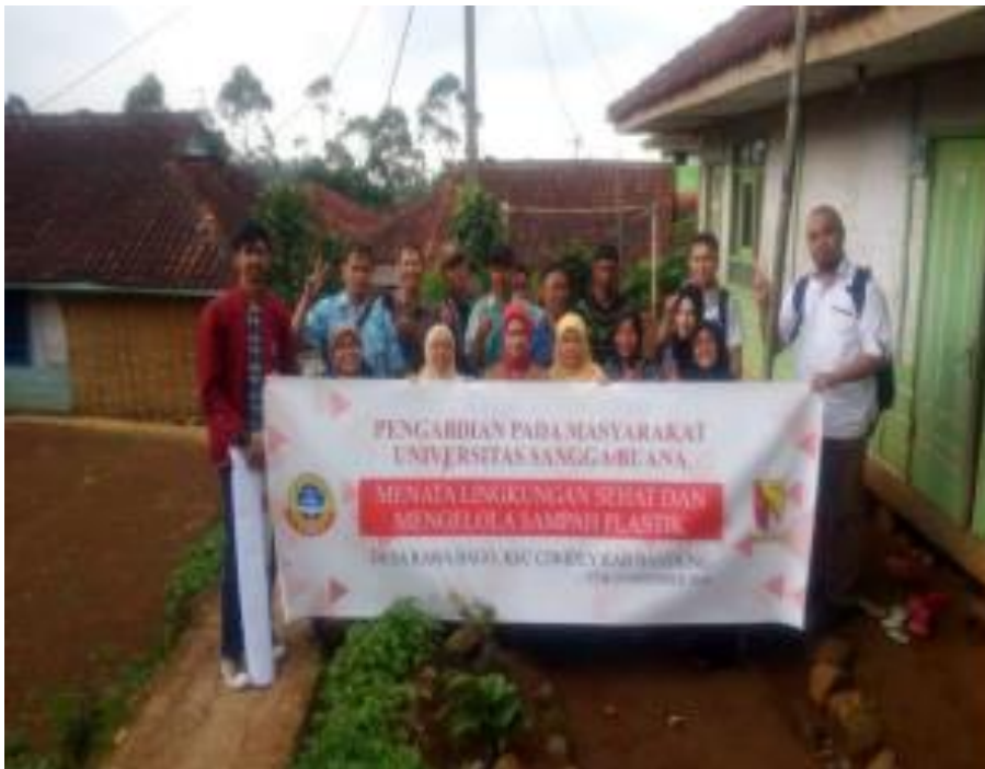
Gambar 1: Tim PKM Teknik Industri Universitas Sangga Buana di Desa Rawabogo

Teknik Industri mengadakan kegiatan Pengabdian Pada Masyarakat di lingkungan Desa 2 Kelurahan Rawabogo Kecamatan Ciwidey Kabupaten Bandung. Pengabdian Pada Masyarakat yang melibatkan para warga, dalam mewujudkan masyarakat yang mandiri untuk hidup sehat, bersih serta hiegienis dan menambah wawasan mengenai pemanfaatan limbah sampah organik dan anorganik yang memiliki nilai tambah/jual.