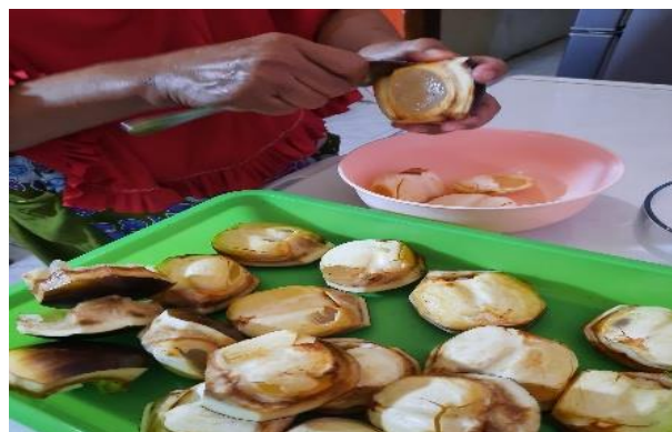
Gambar 2 : Proses Pengambilan Daging Buah Siwalan

juga licin sehingga beresiko melukai tangan apabila tidak dikerjakan dengan benar. Pengupasan dilakukan di atas alas sederhana agar limbah kulit dapat terkumpul dengan rapi serta memudahkan proses lanjutan.