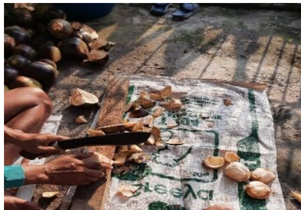
Gambar 1 : Proses Pengupasan Buah Siwalan

Sumi menggunakan pisau dengan waktu pengerjaan 2 jam untuk setiap 10 kg buah siwalan. Kondisi secara nyata tidak hanya membutuhkan tenaga besar, tetapi juga menurunkan efisiensi kerja. Selain itu, hasil rajangan sering kali tidak seragam, yang pada akhirnya dapat mempengaruhi kualitas produk dawet siwalan yang dihasilkan (6).