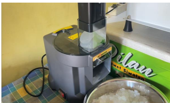
Gambar 5 : Mesin Perajangan

(garis merah) jauh lebih rendah, hanya sekitar 28–35 menit. Angka ini menunjukkan efisiensi yang signifikan karena rata-rata waktu pengerjaan hanya sekitar seperempat dari cara manual. Berdasarkan hasil data harian, terlihat bahwa penggunaan mesin mampu memangkas waktu hampir 70–75% lebih cepat dibandingkan metode manual