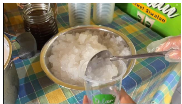
Gambar 6 : Hasil Menggunakan Mesin