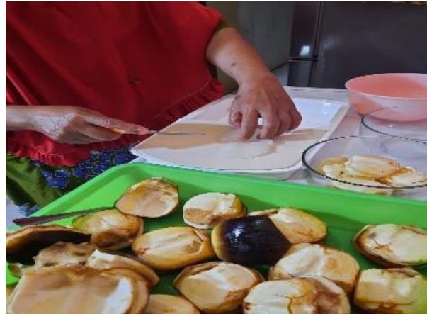
Gambar 3 : Proses Perajangan Manual

kebersihannya. Daging buah yang sudah terambil kemudian dipisahkan dan diletakkan pada wadah khusus untuk memudahkan tahap selanjutnya.