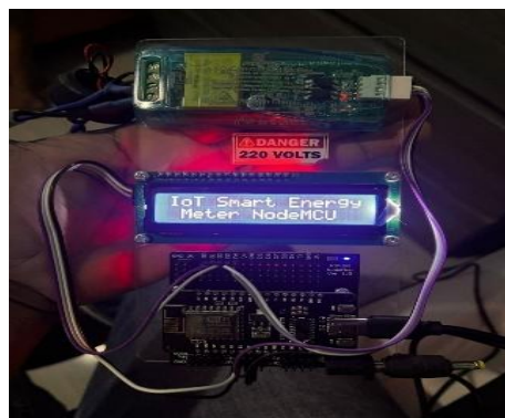
Gambar 2: Prototype sistem Pemantauan power meter berbasis IoT

Prototype yang berhasil dibuat ditunjukkan pada Gambar dibawah ini yang memperlihatkan perangkat sistem monitoring secara fisik, dan Gambar dibawah ini yang memperlihatkan proses pengukuran parameter beban listrik.