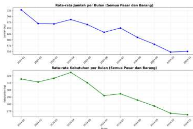
Gambar 1: Tren Global Rata-Rata Jumlah dan Kebutuhan Barang Tahun 2024

baik pada rata-rata jumlah maupun kebutuhan barang sepanjang tahun 2024. Bulan Januari tercatat sebagai periode dengan rata-rata jumlah tertinggi, sedangkan kebutuhan tertinggi terjadi pada April. Hal ini mengindikasikan adanya penurunan simultan antara suplai dan permintaan barang, sebagaimana ditunjukkan pada Gambar 1.