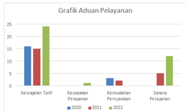
Gambar 2. Grafik Jumlah Aduan

Berdasarkan tabel 1 dapat disimpulkan total aduan masyarakat terhadap pelayanan dalam hal kewajaran tarif, kecepatan pelayanan, kemudahan persyaratan dan sarana pelayanan mengalami peningkatan setiap tahunnya. Tahun 2020 terdapat 18 jumlah aduan, tahun 2021 terdapat 22 jumlah aduan dan tahun 2022 terdapat 37 jumlah aduan.