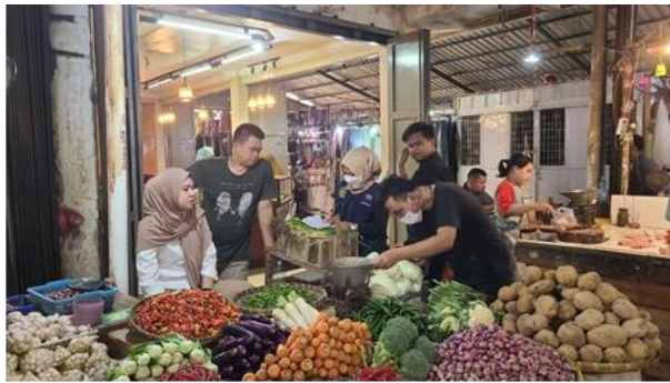
Gambar 1. Pelayanan Tera di Pasar

Metrologi Legal adalah ketelitian pengukuran untuk mengelola metoda-metoda pengukuran dan alat ukur, serta satuan-satuan ukuran yang menyangkut persyaratan teknik dan peraturan berdasarkan Undang-undang dalam hal kebenaran pengukuran bertujuan untuk melindungi kepentingan umum (Mardiansyah & Angrum Adisti, 2017). Unit Pelaksana Teknis Daerah (UPTD) Metrologi Legal Kabupaten Purwakarta merupakan salah satu unit pelayanan masyarakat dari pemerintahan yang melaksanakan kegiatan kemetrolgian dalam rangka menjamin kebenaran pengukuran alat Ukur, Takar, Timbang dan Perlengkapannya (UTTP). Berikut merupakan salah satu gambar dari kegiatan pelayanan tera yang dilakukan oleh UPTD Metrologi Legal Kabupaten Purwakarta.