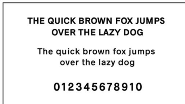
Contoh Tipografi Radnika

Tipografi yang digunakan pada photobook ini yaitu jenis Radnika karena memberikan kesan akrab dan sederhana serta mudah dibaca.