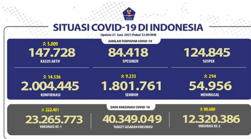
Gambar 1.1 Data Situasi COVID-19 di Indonesia per tanggal 21 Juni 2021.

Sejumlah data dan fakta menyebutkan bahwa penyebaran COVID-19 di Indonesia masih terbilang sangat tinggi.