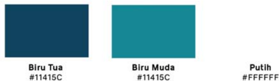
Contoh warna yang digunakan

Warna yang akan digunakan pada photobook ini yaitu menggunakan warna biru yang mengartikan ketabahan, dan background halaman isi menggunakan warna putih yang mengartikan sebuah harapan.