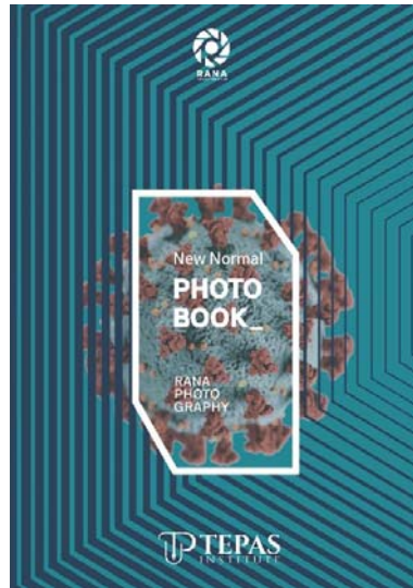
Contoh cover depan