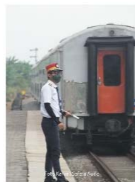
26 | Photobook by RANA