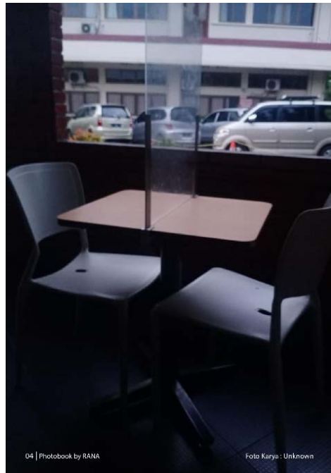
Contoh halaman isi format proporsi