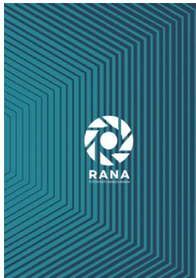
Contoh cover belakang