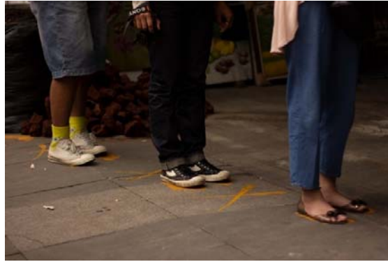
Contoh foto kebiasaan baru