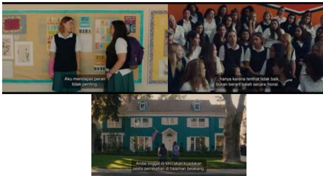
(Adegan-adegan yang menggambarkan kepribadian Christine)

keinginan atau alasan untuk memilihkan nama untuk anaknya. Melalui nama, orang tua menaruh harapan anaknya menjadi seperti yang diharapkan.