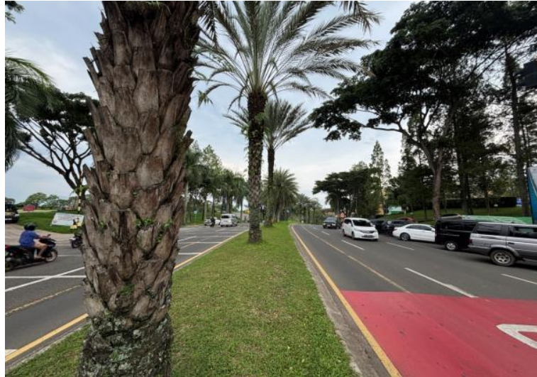
Gambar 10: Jalan Utama di KBP