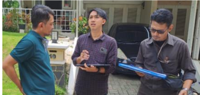
Gambar 7: Wawancara dengan Warga