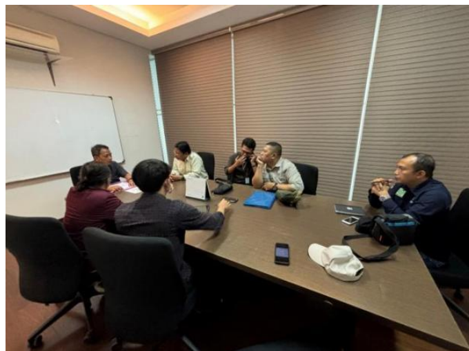
Gambar 5: Wawancara dengan Pengelola

"Sebagai pengelola Kota Baru Parahyangan, kami senantiasa berkomitmen untuk menjaga seluruh fasilitas dan ruang terbuka hijau agar tetap terawat dengan baik. Melalui upaya-upaya yang konsisten, kami berupaya mewujudkan lingkungan yang bersih, hijau, dan asri demi mendukung kesehatan serta kenyamanan seluruh penghuni. Dengan demikian, kami berharap dapat terus berkontribusi dalam mewujudkan visi Kota Baru Parahyangan sebagai kota mandiri yang berwawasan pendidikan."