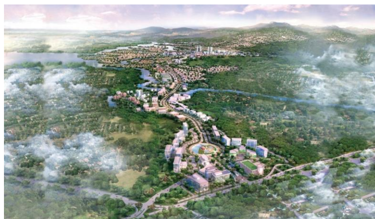
Gambar. 3 Lokasi Kota Baru Parahyangan

Kota Baru Parahyangan adalah suatu kota terencana yang terletak di Padalarang, Kabupaten Bandung Barat, Jawa Barat.