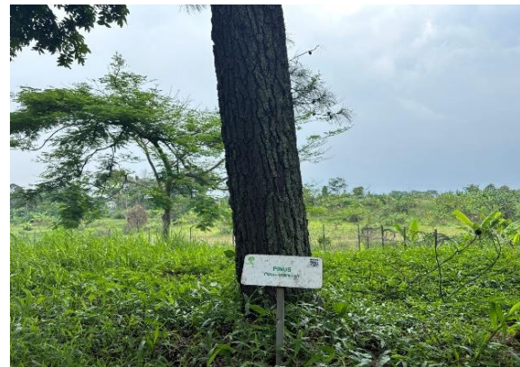
Gambar 6: Jenis tanaman yang berkontribusi terhadap netra karbon KBP