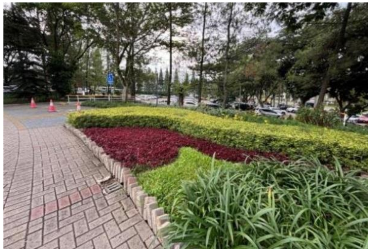
Gambar 11: Rain garden di Bahu Jalan