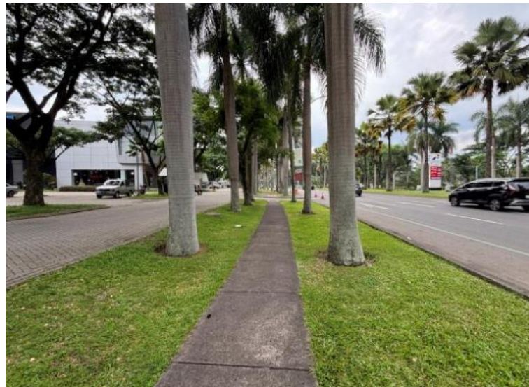
Gambar 9: Bentuk jalan Pedestrian

Dapat dilihat pada Gambar 9, Gambar 10, Gambar 11 dan Gambar 12 bahwa KBP memiliki taman-taman hijau sepanjang jalan utama, jalan pedestrian dan jalur sepeda sehingga memberikan kesan yang asri dan menambah estetika KBP.