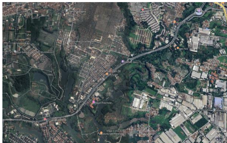
Gambar 2: Peta Kota Baru Parahyangan

Penelitian ini berfokus pada Kawasan Kota Baru Parahyangan (KBP), sebuah proyek pengembangan kota mandiri seluas 1.250 Ha di Bandung Barat. KBP memanfaatkan potensinya dengan menerapkan konsep hijau yang komprehensif. Hal ini tercermin dari upaya pelestarian dan pengelolaan Ruang Terbuka Hijau (RTH) yang dapat dilihat pada Gambar 2 dan Gambar 3.