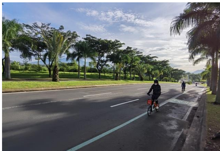
Gambar 12: Jalan utama dengan jalur sepeda