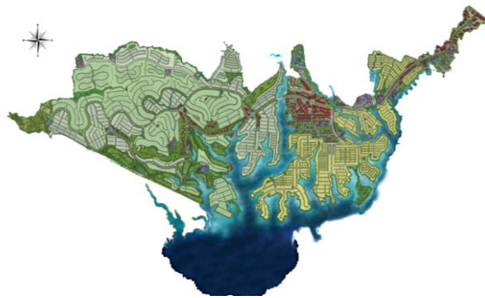
Gambar 4: Gambar Detail Lokasi KBP

lainnya, seperti hunian yang terdiri dari perumahan berkepadatan rendah, menengah dan tinggi, kondominium, apartemen, town house yang dilengkapi dengan fasilitas kota bisnis seperti officer parks , open mall , hotel, ritel, dsb. Selain itu terdapat pula fasilitas rekreasi seperti rekreasi air, jogging track, 18 holes golf course , hotel resort, pasar seni, dan sarana pendidikan yang akan tersedia dari group bermain anak anak ( play group ) hingga universitas yang dapat dilihat pada Gambar 4.